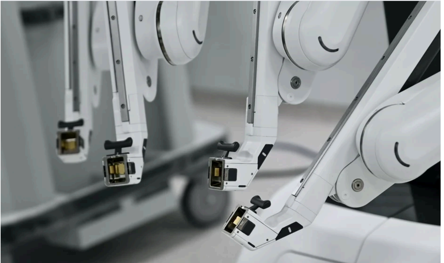
Precizne ručice robota Da Vincija mogu zaviriti u segmente nedokučive ljudskom hirurgu

Mr.sc. Kalem osvrnuo se i na najvažnije kriterije koje jedna bolnica mora imati. Prvi podrazumijeva rezultate liječenja, a drugi higijenu, što je nešto čega se strogo drže u Priori.