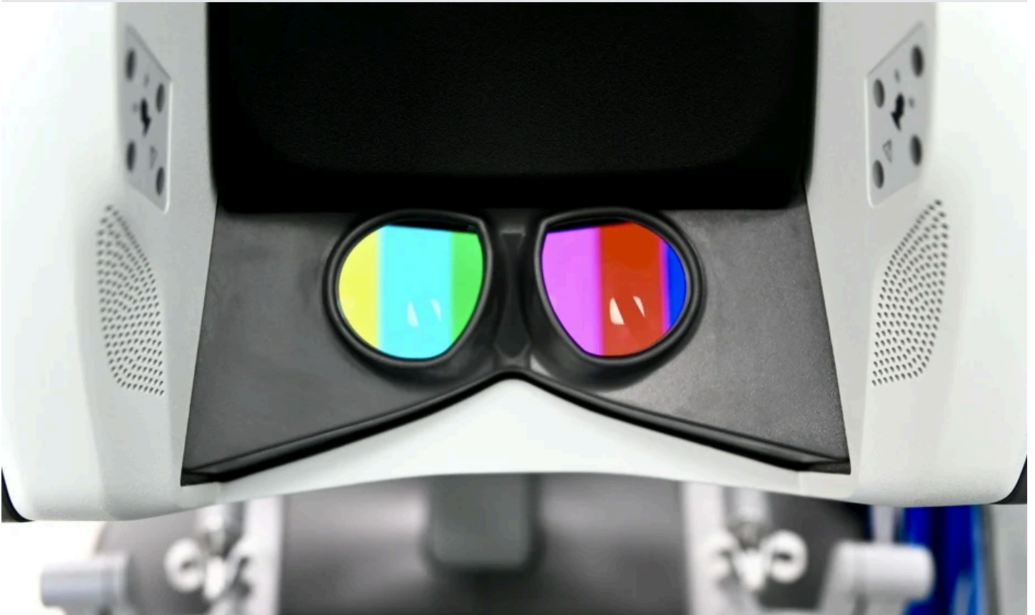
Potpunu kontrolu nad robotom Da Vincijem ima hirurg

Veliki je luksuz i to što ovdje jednim klikom zaustavljate krvarenje. Inače je krv znak za paniku i hitan slučaj, međutim, ovdje je rizik minimalan. Rane su gotovo nevidljive, oporavak kratkotrajan i sve su to ogromne prednosti za pacijenta.