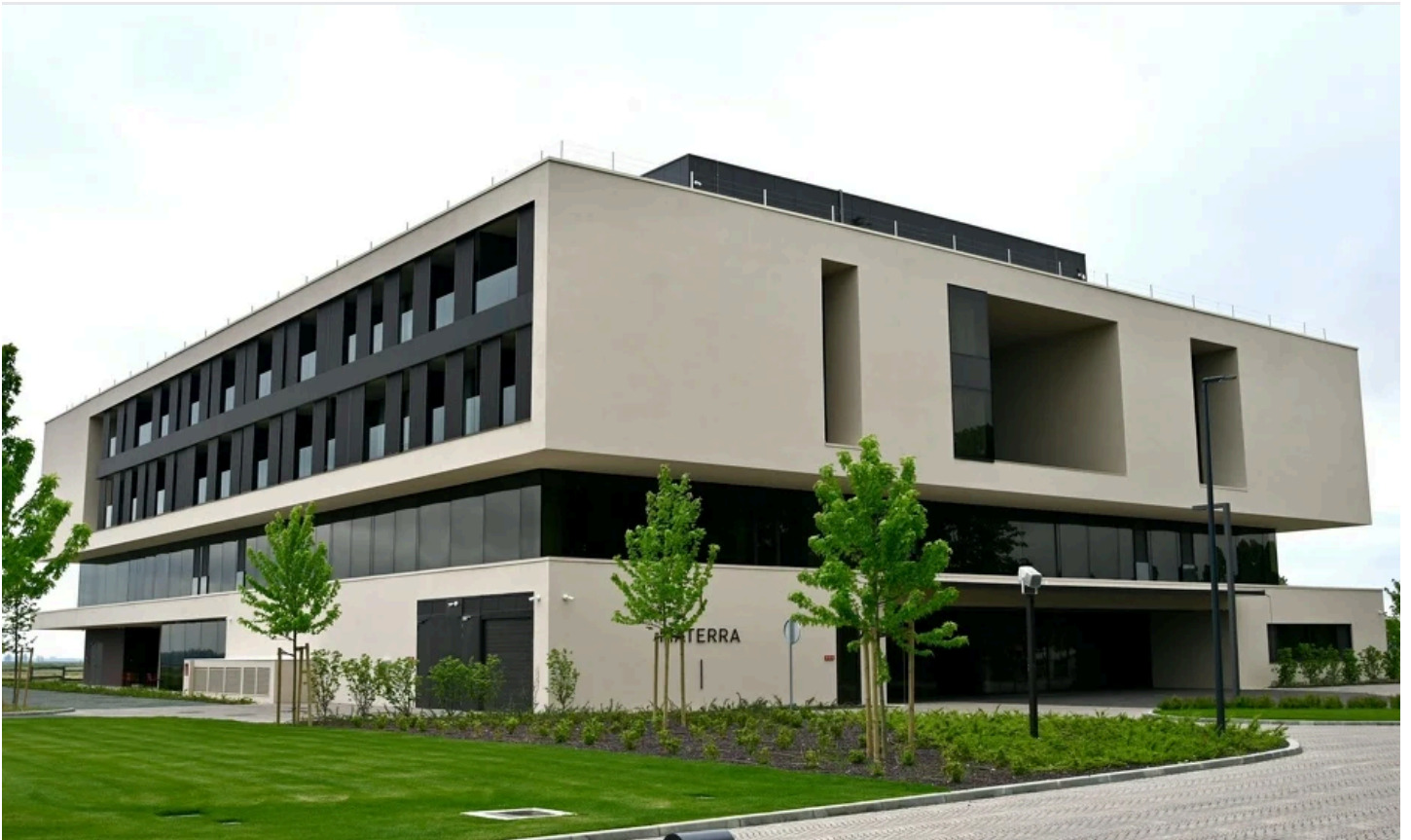
Luksuzni hotel Matterra, mjesto je koje "prati" bolnicu i prije svega obezbjeđuje smještaj za njene pacijente