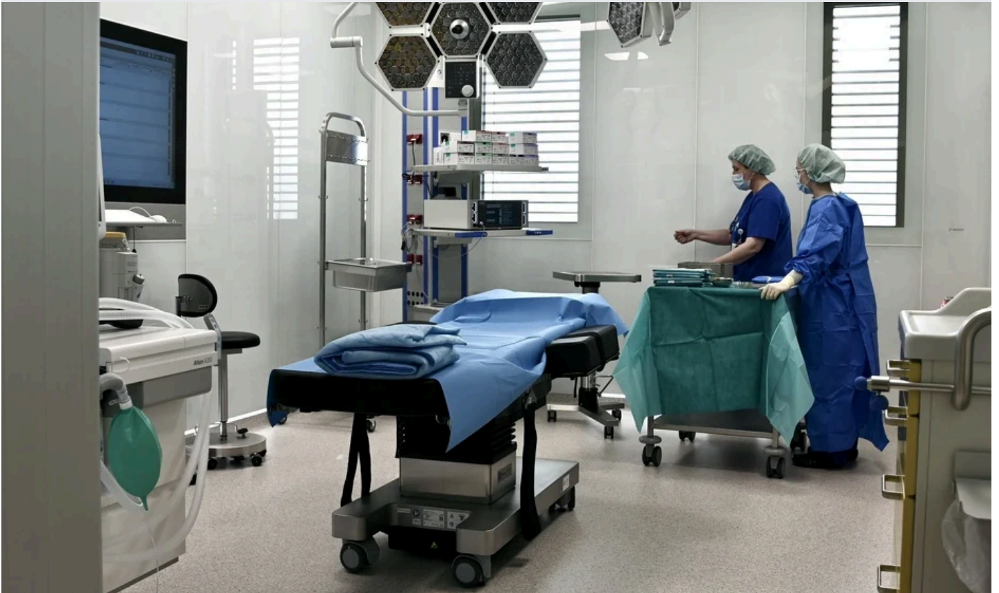
Osim kurativnog, Priora je fokusirana i na edukativni pristup

Mi u Priori želimo ostaviti nešto iza sebe. Divno je raditi nešto novo i stvarati. Nema ništa bolje kao educirati mlade i družiti se s njima. Generacije koje su sada s nama će za pet godina biti vrhunski hirurzi. Kroz akademiju, svi mladi ljudi imati će priliku da dođu ovdje i nešto nauče. Čak ćemo ići i sa vrlo niskim kotizacijama, da bi svi koji žele, a nemaju finansijske uslove, mogli učestvovati.