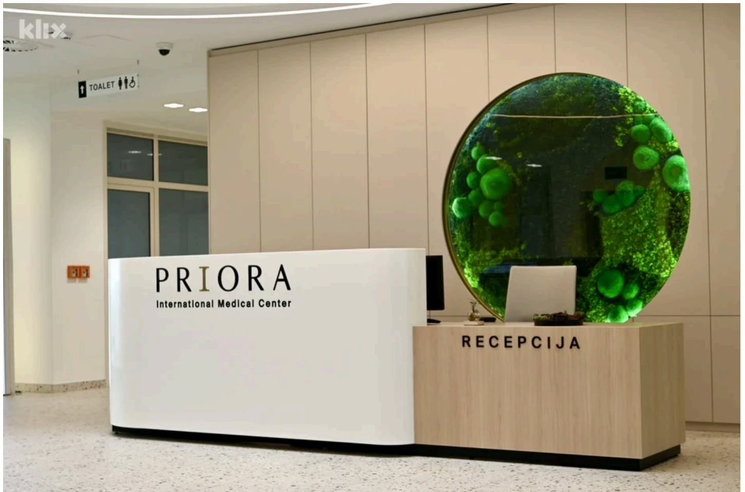
Priora je medicinski centar na 6.000m2 u kojem je sve na vrhunskom nivou

napravili ijednu grešku i to nas čini jako sretnima. Ono što je izuzetno je i osoblje bolnice koje smo imali priliku birati iz Kliničkog bolničkog centra Osijek sa oko 3.000 zaposlenih. Odabrali smo samo najkvalitetnije kadrove.